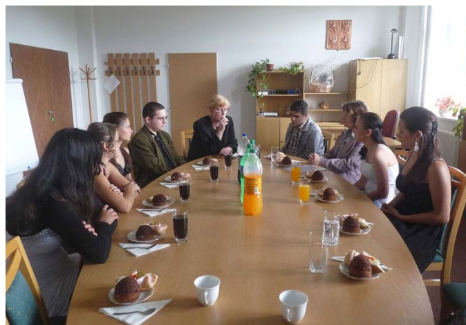
přijetí žáků starostkou města